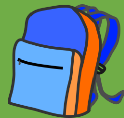
PRIPRAVLJANJE ŠOLSKE TORBE